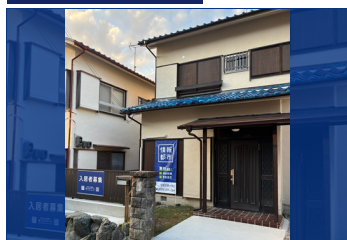
阪南市舞4丁目戸建 築51年（昭和48年10月） 建物：69.95㎡ / 21.15坪