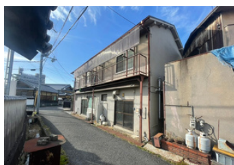
泉佐野市中庄テラスハウス 築55年（昭和44年1月） 建物：112.47㎡ / 34.02坪