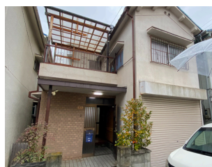
忠岡町馬瀬戸建 築52年（昭和47年3月） 建物 86.94㎡ / 26.29坪